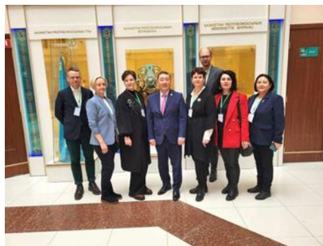
EKA vizīte Kazahstānā, 2024. gada 10.-14. martā

UnWaste finansē un atbalsta Eiropas Komisija, Erasmus+ programmas 2. pamataktivitāte – Sadarbības partnerības augstākajā izglītībā (Projekta ref. nr. 618715-EPP-1-2020-1-1-DE-EPPKA2-CBHE-JP).