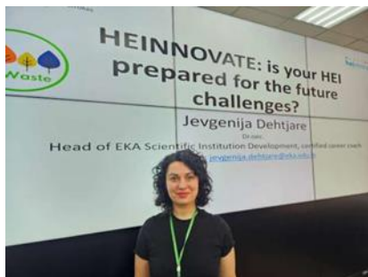
HEInnovate iniciatīvas seminārs Kazahstānā, 2024. gada 12. martā