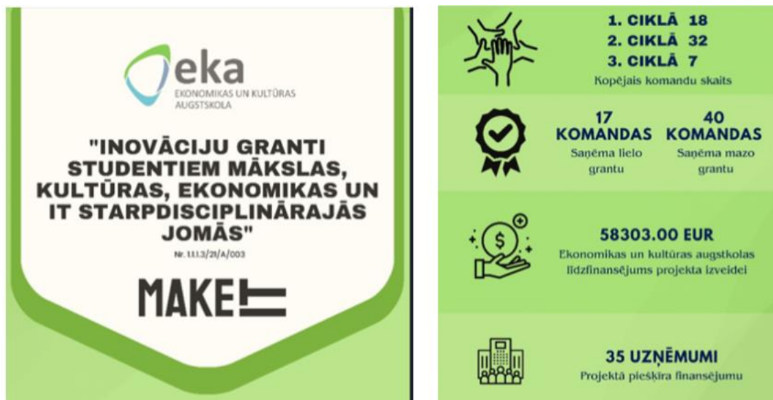
1. attēls. MAKE-IT projekta rezultāti

Projekts tika īstenots sadarbībā ar partneriem: "Ekonomikas un kultūras augstskolas fonds", Banku Augstskola, Nodibinājums "Ventpils Augsto tehnoloģiju parks", SIA "ALBERTA KOLEDŽA", SIA "Latvijas Zinātņu akadēmijas Ekonomikas institūts" un SIA "EUROLDCS".