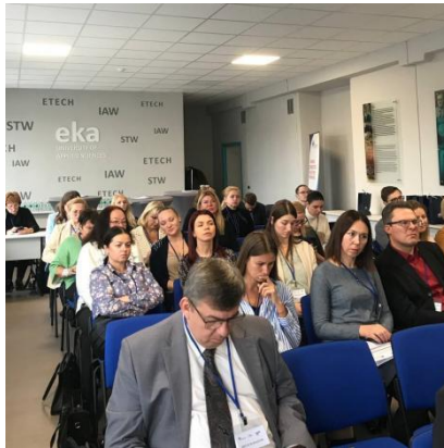
FuturEDU konference Rīgā 2023. gada 8.-9. novembrī

Kā DLearn biedrs Ekonomikas un kultūras augstskolā no 2023. gada 8. novembra līdz 9. novembrim Rīgā notika starptautiskā zinātniskā un izglītības konference FuturEDU 2023. Pasākums tika organizēts pēc DLearn lūguma un sadarbībā ar to. Starptautiskā pasākumā piedalījās vadošie eksperti, pedagogi un ieinteresētās puses, lai diskutētu un veidotu izglītības un prasmju nākotni digitālajā laikmetā. FuturEDU 2023 nodrošināja platformu pārdomas provocējošām diskusijām, zināšanu apmaiņai un kontaktu veidošanai starp izglītības speciālistiem, veicinot inovāciju un sadarbību, lai veidotu izglītības un prasmju nākotni.