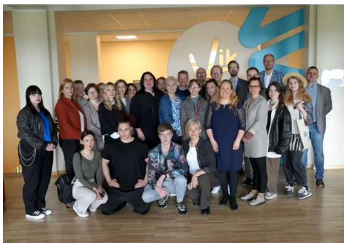
VILESA noslēguma sanāksme Viļņā, 2024. gada 14.-15. maijā

VILESA projektu finansē un atbalsta Eiropas Komisija, Erasmus+ programmas 2. pamataktivitāte – Sadarbības partnerības augstākajai izglītībai (granta līguma Nr. 2021-1-LT-01-KA220-HED-000023551).