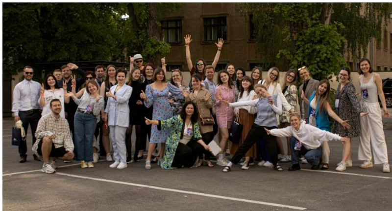
Studentu konferences dalībnieki, 18.04.2024.