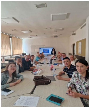
Tikšanās AlmaU, Astanā, 2023. gada 14.-18. augustā