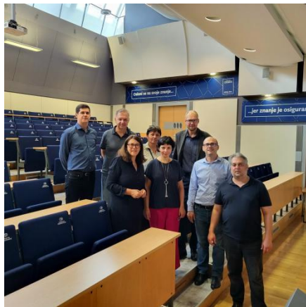
BENEFIT sanāksmes dalībnieki Zagrebā, 2023. gada 14.-15. septembrī

2023. gada 14. un 15. septembrī Ekonomikas un kultūras augstskola piedalījās starptautiskā projekta BENEFIT partneru sanāksmē Zagrebā, Horvātijā.