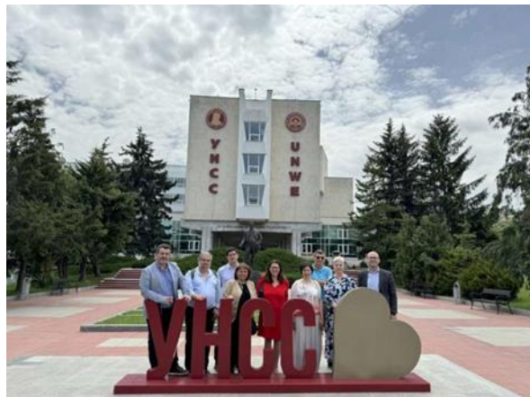
Benefit sanāksmes dalībnieki Sofijā, 2024. gada 3.-4. Jūnijā