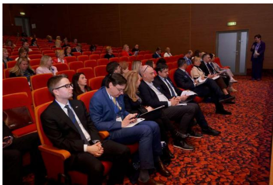
etECH2024 plenārsēde 25/04/2024