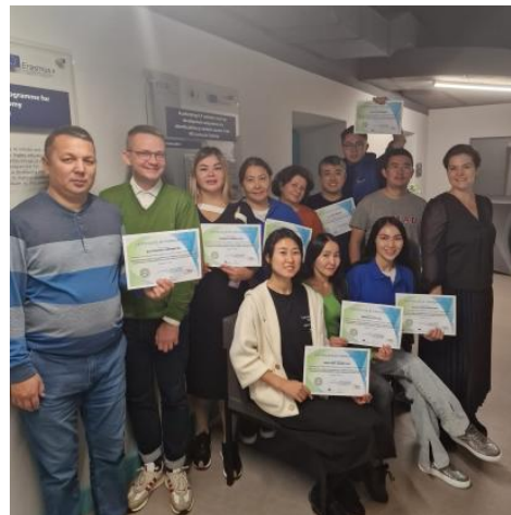
Tikšanās Rīgā 2023. gada 2.-6. oktobrī

No 2023. gada 2. līdz 6. oktobrim vairāku Kazahstānas augstskolu pārstāvji apmeklēja EKA "UXiship" un "UnWaste" projektu ietvaros. Vizītes laikā visas nedēļas garumā tika organizētas dažādas treneru sagatavošanas "Train-the-Trainer" aktivitātes: lekcijas, diskusijas, paraugdemonstrējumi, ekskursija, kā arī vakariņas. Projekta "UXiship" ietvaros EKA apmeklēja 14 pārstāvji no šādām Kazahstānas universitātēm: Almati vadības universitātes, Š. Jesenova vārdā nosauktās Kaspijas tehnoloģiju un inženierijas universitātes (University of Technology and Engineering named after Sh.Yessenov) un A. Baitursynova vārdā nosauktās Kostanajas Valsts universitātes (A. Baytursynov Kostanay State University).