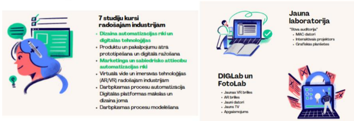
2. attēls. AUTORADE projekta rezultāti

Projekts "Automatizācijas rīki radošajām industrijām (AUTORADE)" (līgums par Eiropas Savienības fondu projekta Nr.8.2.3.0/22/A/004 īstenošanu)