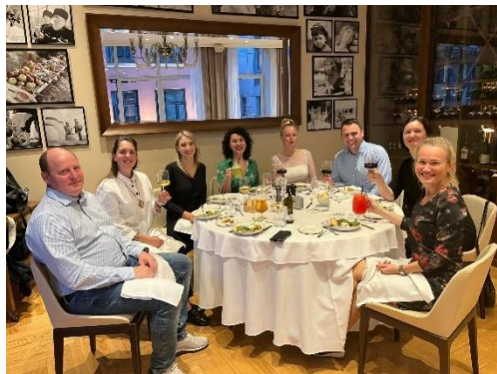
STW2023 noslēguma vakariņas