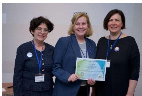
Pedagoģijas un izglītības sekcijas labāko prezentāciju balvu pasniegšanas ceremonija